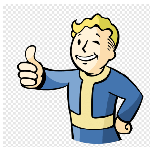
Figura 4.1. Vault Boy approves that