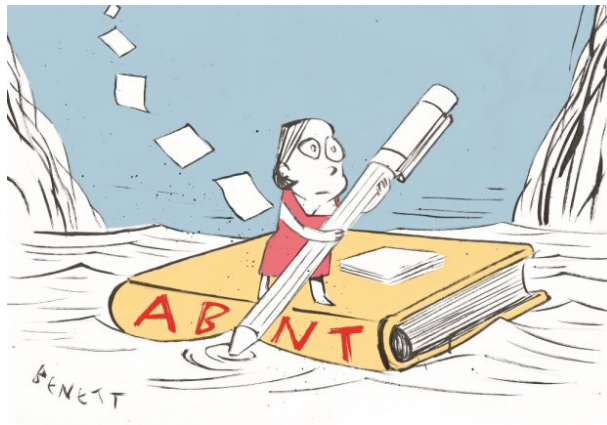
Figura 2 – Exemplo de figura

São desenhos, fotografias, organogramas, esquemas etc. com os respectivos títulos pre-cedidos da palavra Figura e do número de ordem em algarismo arábico. Conforme ilustra a Figura 3.