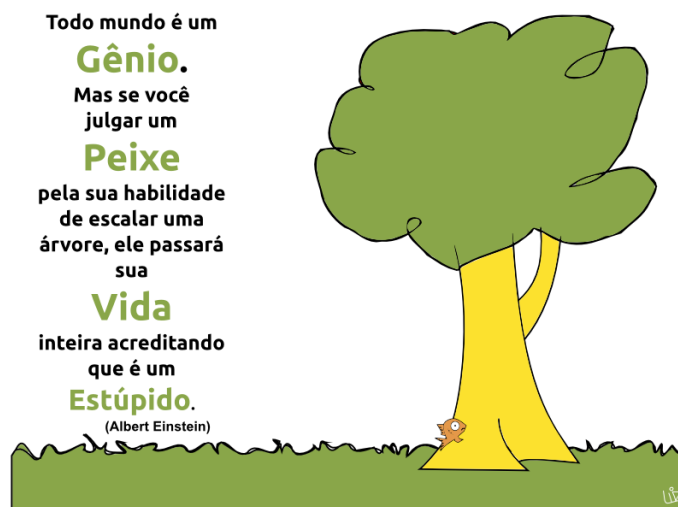
Figura 2.1: Exemplo de Figura.

A Figura 2.1 é um exemplo de como ficará uma figura no seu texto. Note que a legenda fica na parte inferior e tem fonte com tamanho 10 pt (além de espaço simples entre linhas, como você pode notar na Figura 2.2)