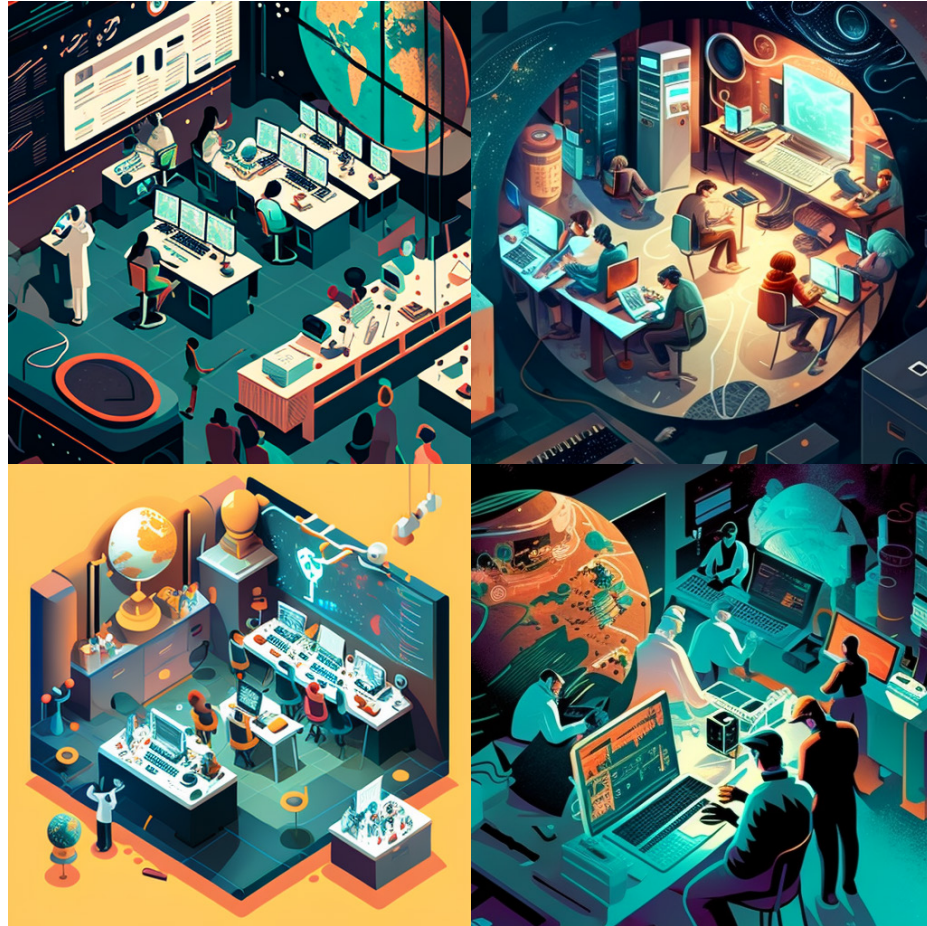
Figura 1. Estas imágenes generadas con IA se produjeron utilizando el texto: "An open science world, with persons interacting with peers and computers". / These AI-generated images were produced based on the text description of "An open science world, with persons interacting with peers and computers".